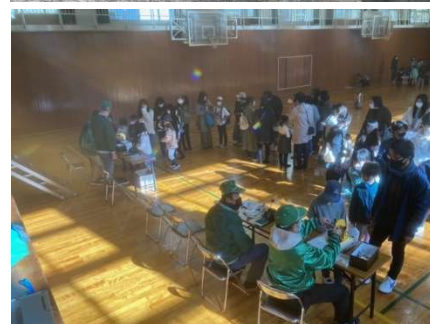
ビンゴ大会の様子